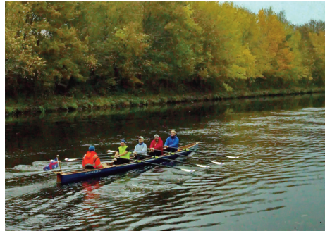
„Wasser wie Speck“

Ich sage Danke den beiden Organisatorinnen und dem gesamten Team für diese sehr harmonische Herbstwanderfahrt.