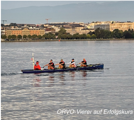
ORVO-Vierer auf Erfolgskurs

Nach nunmehr 12 Stunden und 44 Minuten hatten wir unser Ziel erreicht und