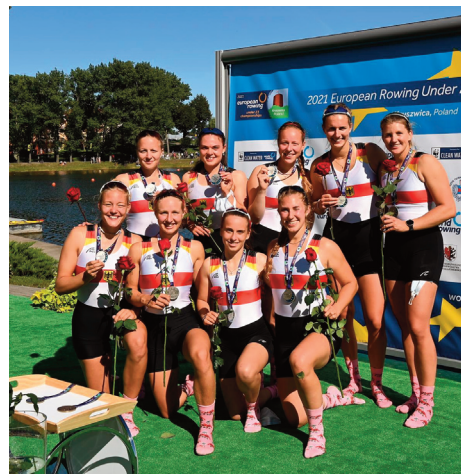
Glückliche Gesichter nach der Siegerehrung