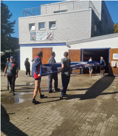
Alles will gelernt sein. Bilder (2): Kai Basedow

So konnten wir in drei Booten die Grundelemente des Ruderns vermitteln und im Anschluss noch Grillen. Für uns alle war das ein unvergesslicher Tag, da wir