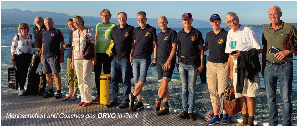
Mannschaften und Coaches des ORVO in Genf

Stunden eine Position unter den vorderen Vieren zu sichern und das viele Training im vornherein zahlte sich aus. Neben dem nicht allzu entspannten Ruderschlag setzte langsam die Müdigkeit