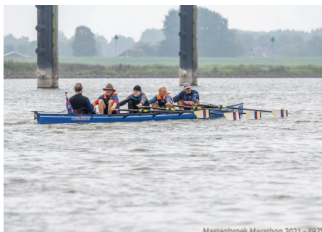
Bilder (3): Mastenbroek Marathon 2021