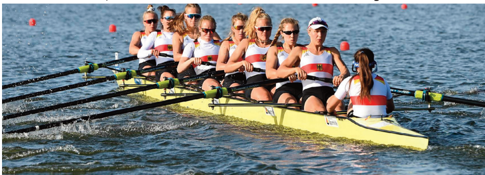
Der Deutschland-Achter auf dem Weg zur Silbermedaille

Bereits im Bahnverteilungsrennen am Samstag zeigte der Deutsche Achter, dass er ein gehöriges Wort um Silber mitzusprechen hat. Trainer Helmkamp gab die Devise aus, dass 1250 Meter der 2000 Meter Strecke unter Volllast gefahren werden sollten und im Anschluss, zum Kräfte sparen, rausgenommen werden soll. Mit dem Wissen, dass man noch zwei Gänge hochschalten kann ging das Team um den Schlagweier Patzelt und