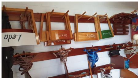
Ordnung ist das halbe Leben

An einem Dienstagvormittag habe ich mit meiner Dienstagsgruppe den Boots-park neu sortiert. Was bedeutet das für uns aktive Mitglieder? Mir fiel schon länger auf, dass Boote und Zubehör nicht in einer Halle vorzufinden war. So entwickelte es sich von selber, wenn keine Skulls für das jeweilige Boot verfügbar